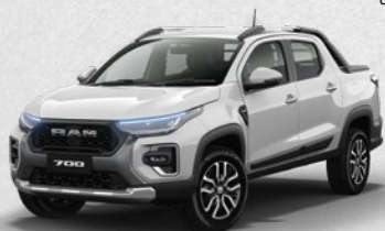
LARAMIE CVT TURBO