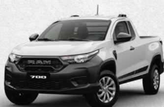
SLT REG CAB