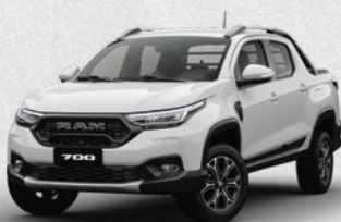
SLT REG CAB • SLT CREW CAB BIGHORN • BIGHORN CVT • LARAMIE CVT